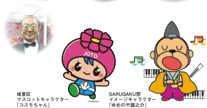
城東区 マスコットキャラクター 「コスモちゃん」